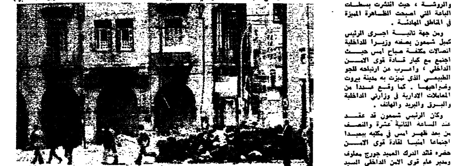
مواطنون يجازون الطريق بسلام في منطقة المهرض أمام مستراسميجور